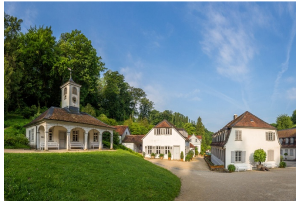
Blick auf das Fürstenlager