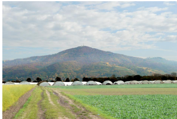
Blick auf den Melibokus während der Rückfahrt